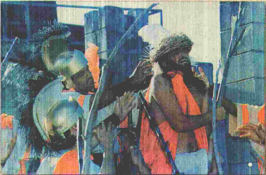
CELEBRAÇÕES cristãs, como as da Páscoa, atraem os brasilienses