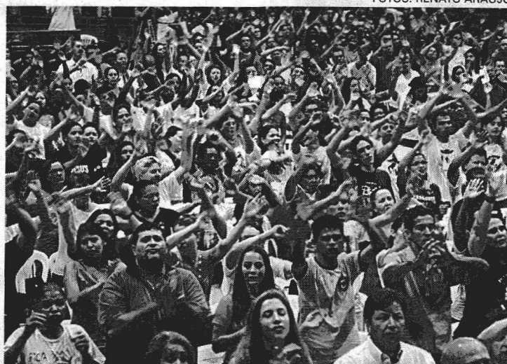
Carismáticos cantaram, rezaram e debateram os rumos da igreja