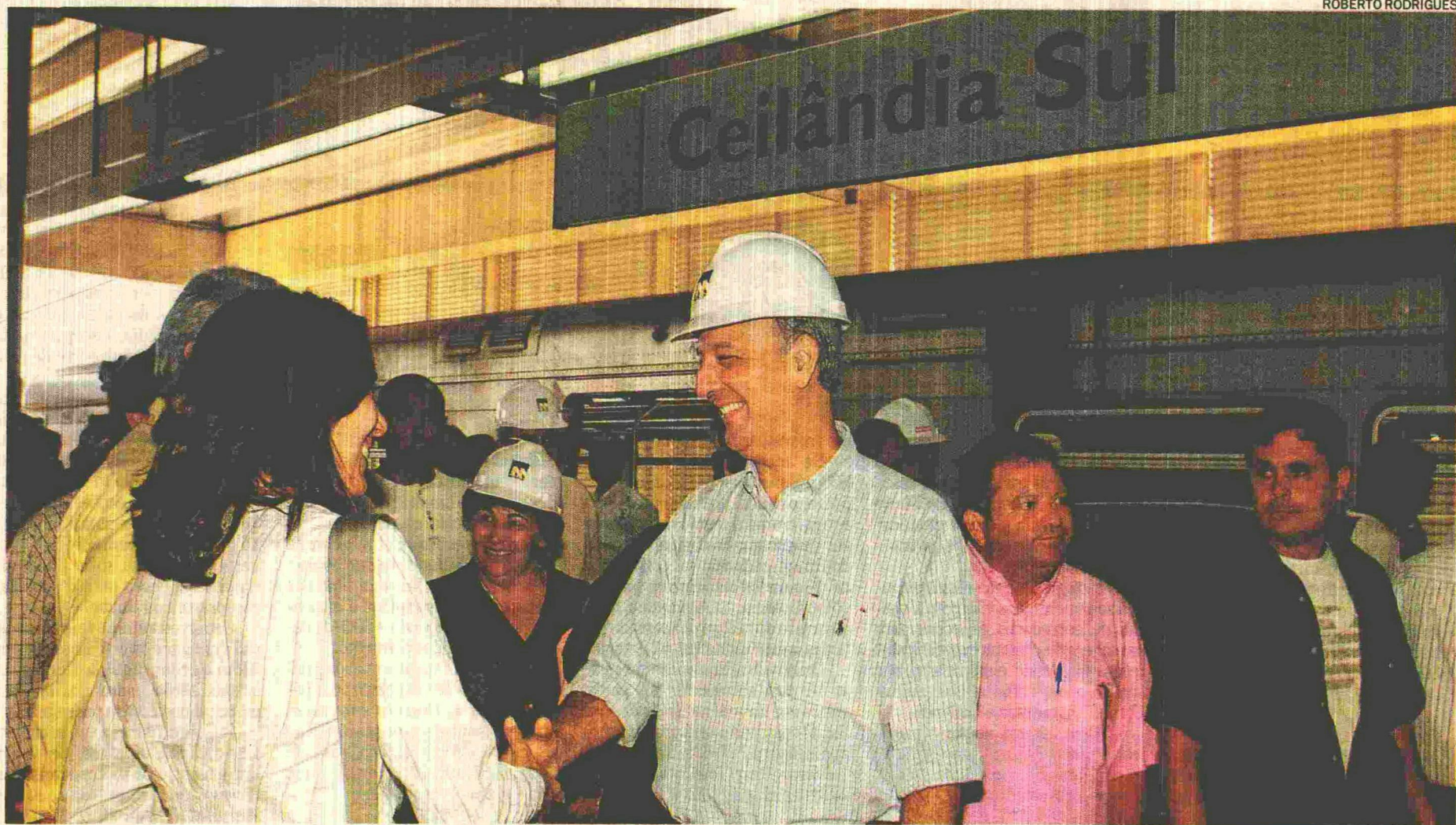
Arruda no Metrô: horário muda para atender demanda noturna, obras em Ceilândia são retomadas e, no futuro, trens serão coluna dorsal do transporte público