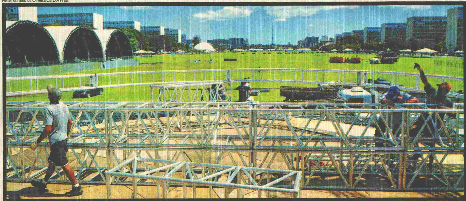
A ESTRUTURA DO PALCO PRINCIPAL TEM MAIS DE 50M DE LARGURA E SÓ DEVE ESTAR TOTALMENTE PRONTA AMANHÃ: NO LOCAL, VÃO SE APRESENTAR, A PARTIR DAS 17H, ARTISTAS DE RENOME NACIONAL

Na altura do Complexo Cultural da República, as arenas das disputas da etapa brasileira do Mundial de Vôlei de Praia e apresentações de futebol estão prontas, assim como as tendas que vão abrigar serviços e exposições das secretarias do Governo do DF do Jardim Botânico e das unidades das polícias Civil e Militar. Vinte e cinco entidades levarão à Esplanada exposições e serviços à comunidade em