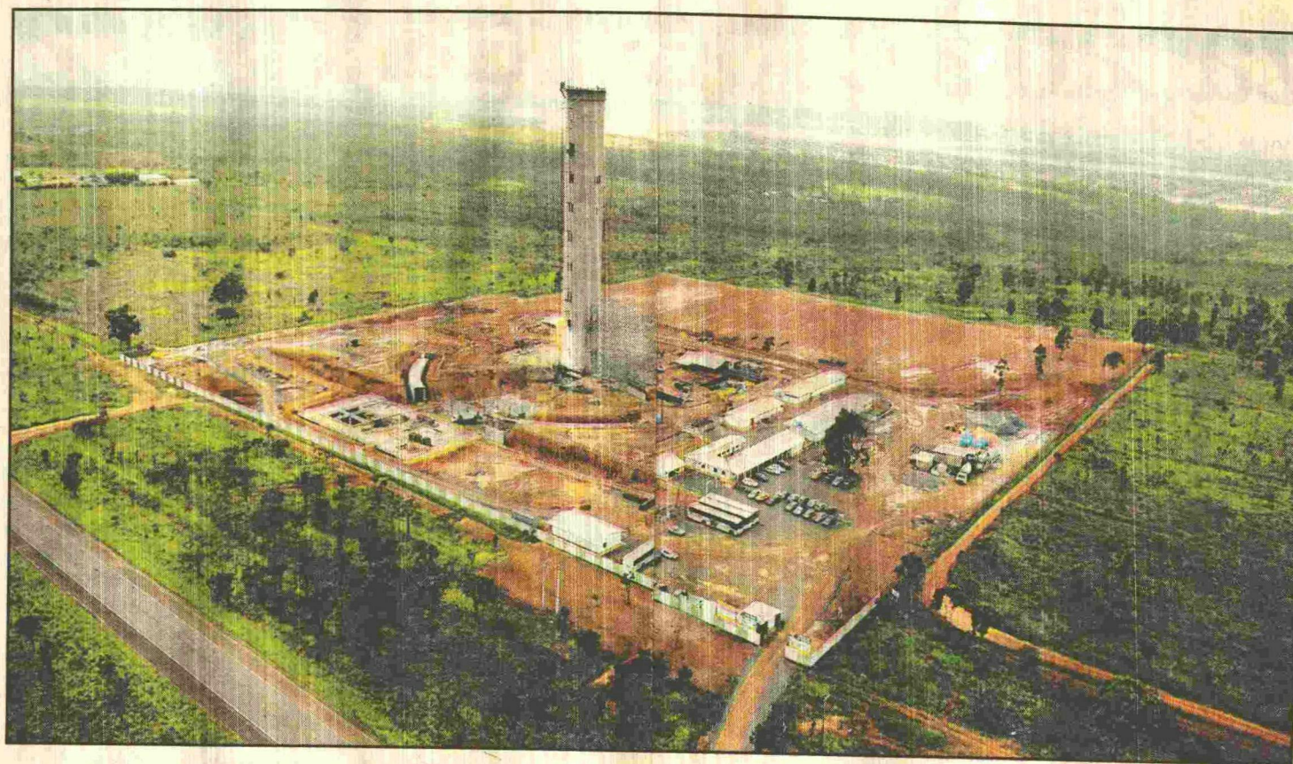
A Torre de Televisão Digital — localizada no Grande Colorado — terá 120m de altura e, até agora, já foram erguidos 95m da estrutura de concreto

A referência às flores do cerrado foi feita por Niemeyer, ao desenhar o monumento. A estrutura de concreto — sem contar os 60m da antena de transmissão — terá 120m de altura. O topo em formato de cálice, a 110m do chão, será utilizado como mirante. Um pouco abaixo, a 82m, uma estrutura de concreto suspensa abrigará o restaurante com 121 metros quadrados de área e capacidade para 30 pessoas. Aos 61m, na pétala semelhante e do lado oposto ao do restaurante, será construída uma galeria de arte para exposições temporárias. Os dois espaços serão revestidos de vidro escuro, com visão panorâmica.