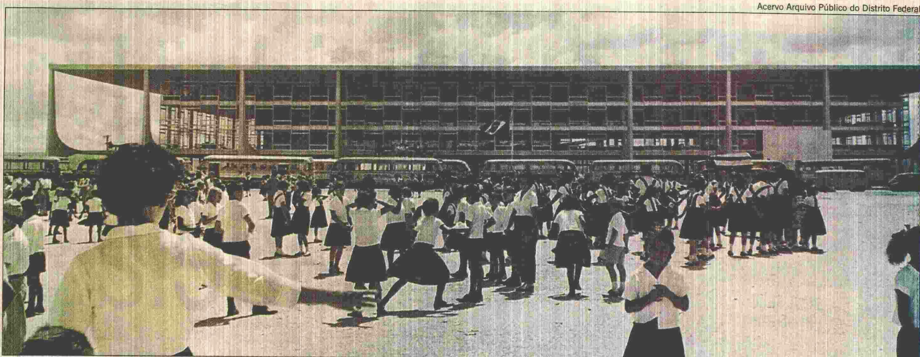
POPULAÇÃO SE ESPALHA em frente ao Palácio do Planalto para acompanhar o dia da inauguração da nova capital federal: dezenas de ônibus enfileirados na Praça dos Três Poderes

O gabarito máximo de seis andares sobre pilotis para os blocos de apartamentos, os setores residenciais divididos em grandes quadras, as amplas calçadas, a distribuição da cidade por setores, a concentração da cúpula do poder na Praça dos Três Poderes e na Esplanada