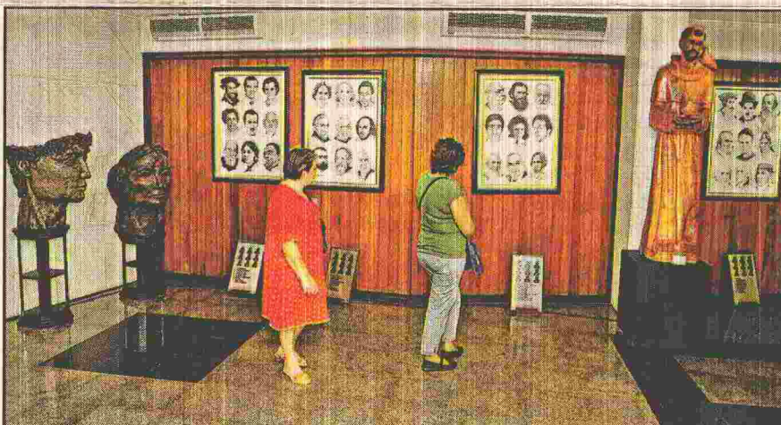
Nas galerias, vultos de expressão em diferentes áreas são homenageados nos quadros