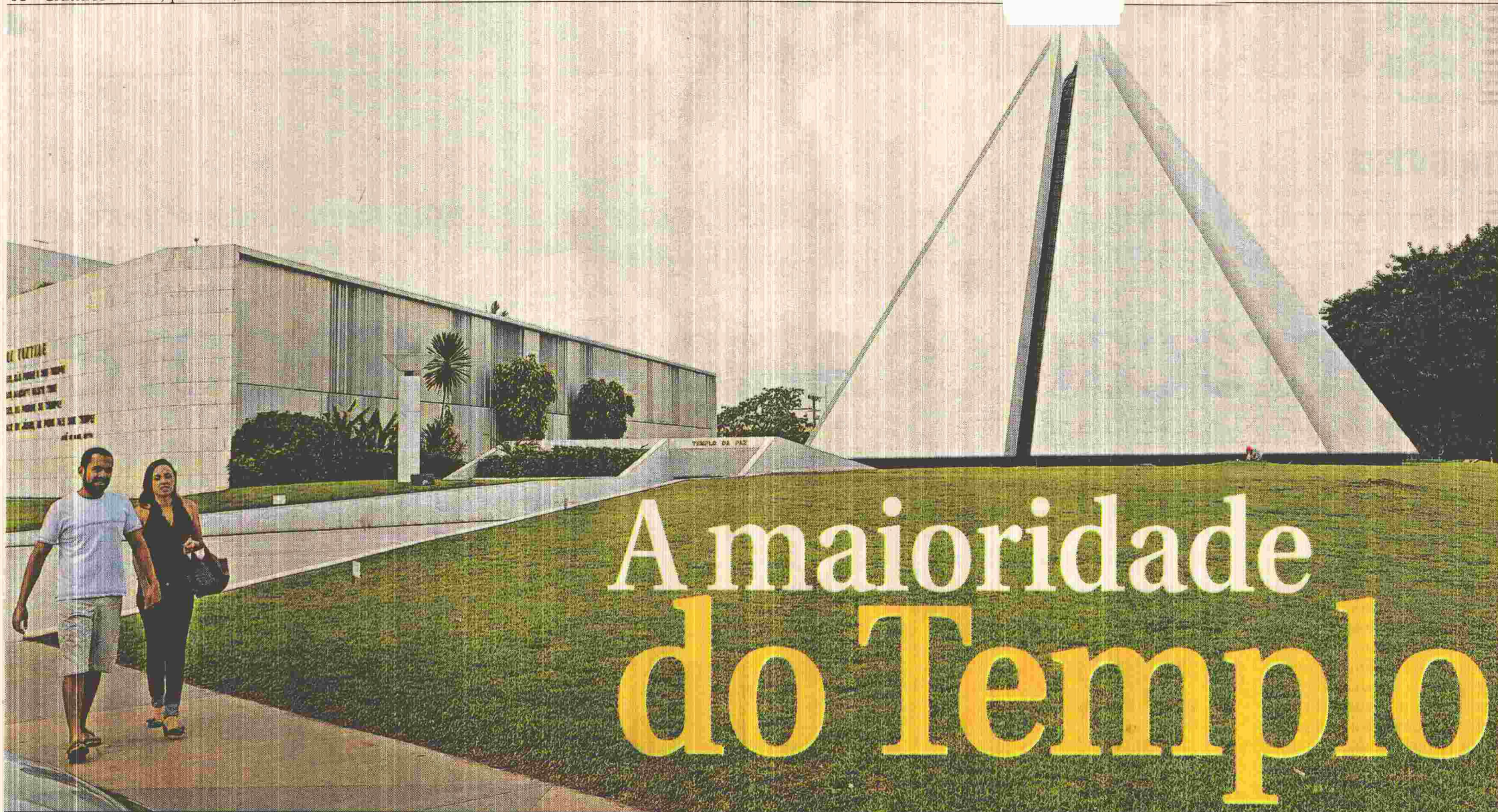
A pirâmide com sete faces — diferente de todas as conhecidas no mundo, que têm quatro — identifica, de longe, o prédio. Em cima dela, um gigantesco cristal estrategicamente instalado irradia luz para dentro do ambiente

Templo da Boa Vontade completa 21 anos em Brasília, onde se destaca como um dos monumentos de maior visitação. O apelo místico da instituição fundada por Alziro Zarur contempla pessoas de diferentes religiões, bem como aquelas sem qualquer vínculo religioso: é uma casa aberta que incentiva, principalmente, a prática da meditação