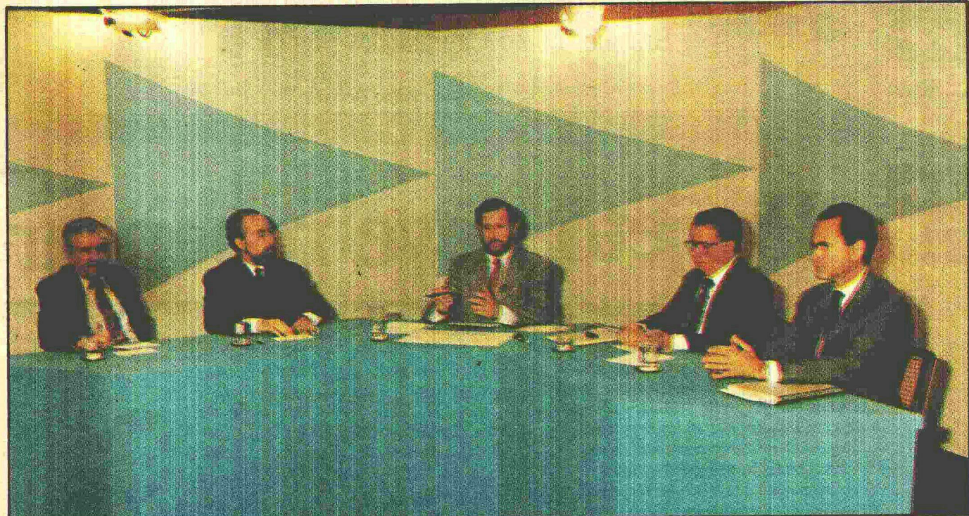
A terceira mesa-redonda do seminário Brasília em Debate abordou as funções da Capital Federal