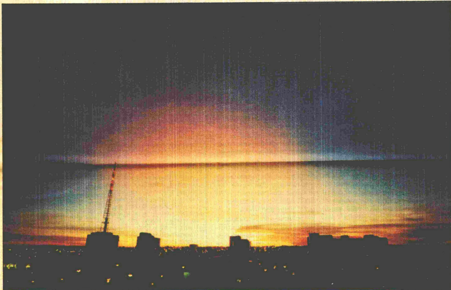
O crescimento da cidade, a partir do Plano Piloto, deve obedecer as normas que elevaram Brasília a Patrimônio Cultural da Humanidade

Goiás prejudica Brasília com os seus impostos