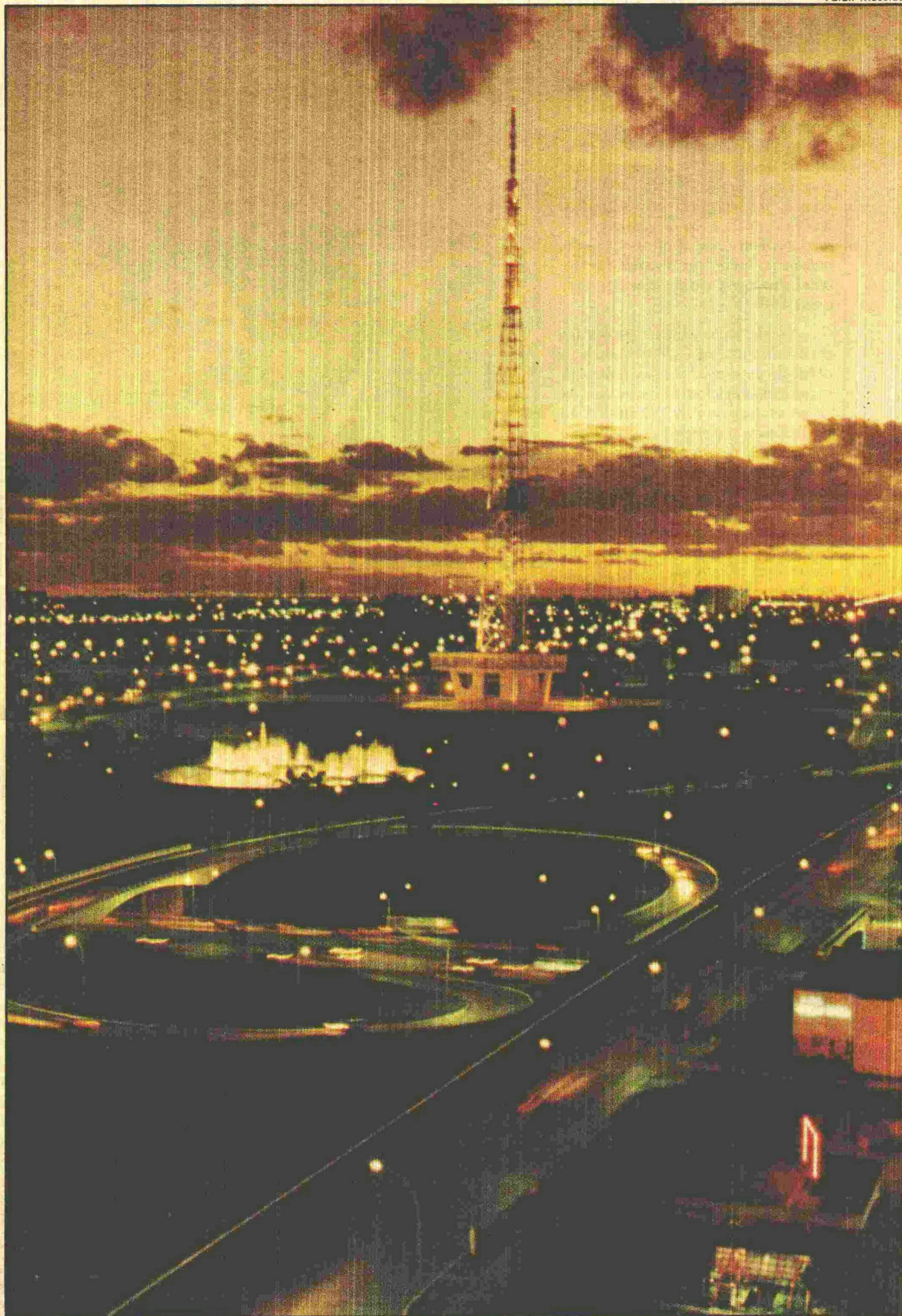
Brasília recebe novas propostas para consolidar seu crescimento e independência econômica