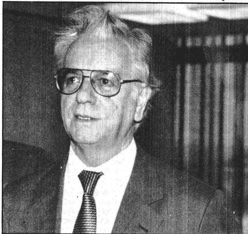
Itamar quer o governo ajudando nas investigações da CPI

Já o coordenador da Comissão de Subvenções, senador Garibaldi Alves (PMDB-RN), reclamou da demora na entrega de informações por parte de alguns órgãos do Governo. "Em relação às entidades assistenciais e prefeituras, está faltando chegar informações de quebra de sigilo por parte do Banco do Brasil", disse o senador.