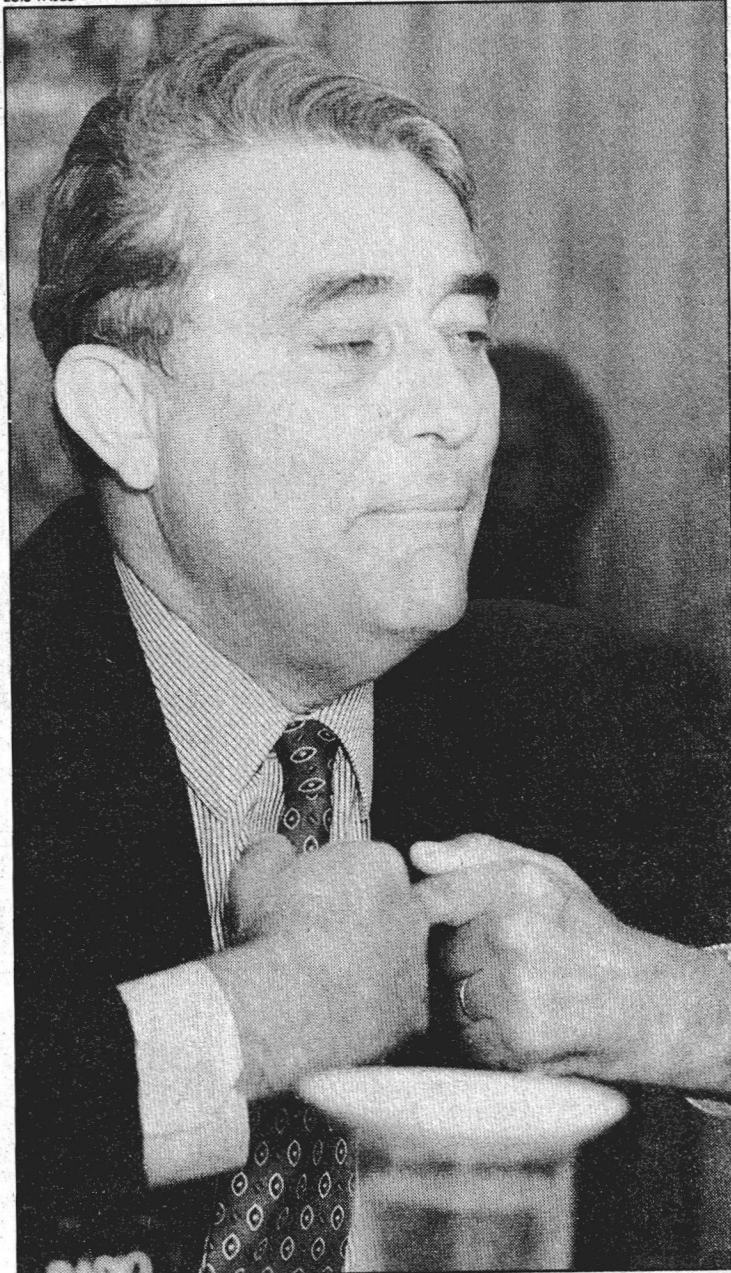
Roriz nega que tenha tido saldos bancários tão altos