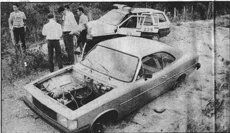
O Opala depenado foi encontrado próximo ao Vale do Amanhecer