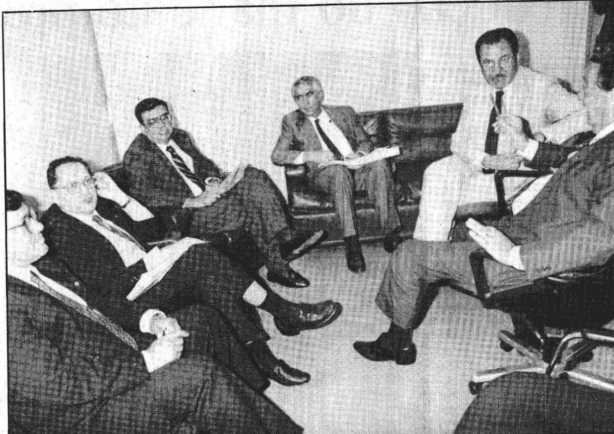
Os integrantes da CPI têm provas para propor a cassação de um suplente, um senador e 15 deputados

A intenção dos líderes partidários e do presidente da Câmara, deputado Inocêncio Oliveira, é iniciar a votação da cassação dos mandatos naquela Casa a partir do próximo dia 16. O relatório final da CPI deve ser encaminhado à Comissão de Constituição e Justiça da Câmara — cujos novos membros serão eleitos no dia 1º de fevereiro — imediatamente após a aprovação na próxima segunda-feira. Inocêncio Oliveira anunciou que pretende fazer até quatro votações de cassações diárias, gastando no máximo 40 dias nesse processo. No Senado, o tempo deverá ser um pouco maior, atingindo três meses.