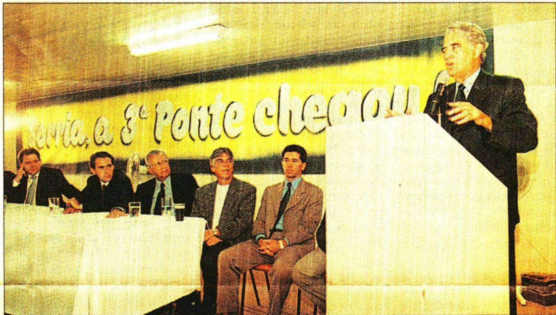
Roriz: benefício aos moradores da QL 26 e do Jardim Botânico, São Sebastião e Paranoá

Rodoviária do Plano Piloto em 15 quilômetros. O tráfego no novo acesso foi estimado em 25 mil veículos por dia.