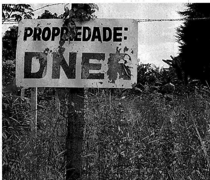
No conjunto 1 da QL 26 está o único lote com identificação

Na foto acima, a vista privilegiada de uma das áreas mais valorizadas de Brasília entregue ao mato. Ao lado, um lote anexado pelo vizinho, que cuida como se fosse o próprio dono. A Administração do Lago Sul tem insistido com a Secretaria de Patrimônio da União para que, pelo menos, limpe os terrenos, mas as tentativas têm sido infrutíferas.