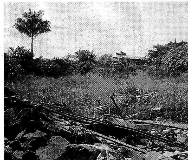
Entulho e mato tomam conta deste lote no conjunto 12 da QI 19