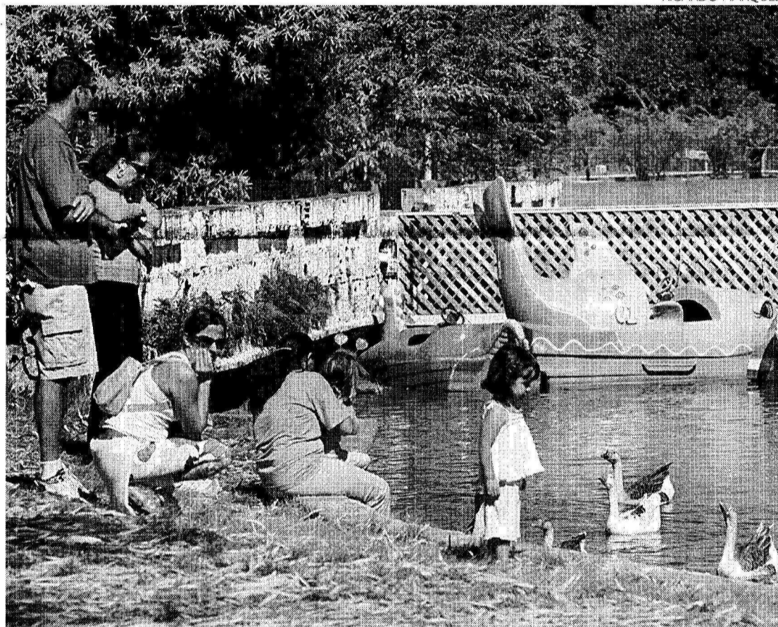
■ PEDALINHO ESTÁ ENTRE AS ATRAÇÕES QUE ESTÃO ABANDONADAS NO PARQUE: REVITALIZAÇÃO À VISTA