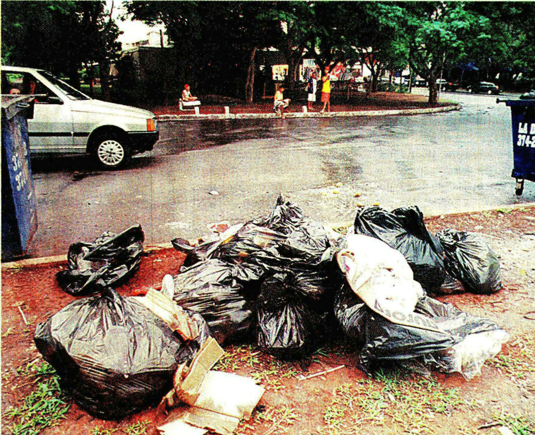
Lixo na rua e contêineres revirados: cena comum que desagrada a todos nas quadras 404/405 Sul

Para Expedito, realmente fica desconfortável um lixo na frente de um restaurante e a Belacap tomará atitudes para melhorar essa disposição. "Não temos fiscais de plantão no fim de semana, então somente na segunda-feira vamos verificar o que pode ser feito", esclarece.