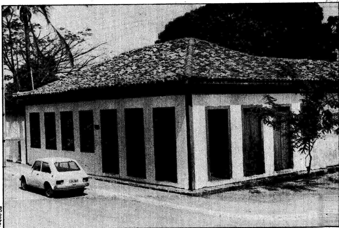
A linha de trabalho a ser adotada pelo Museu está sendo motivo de discussões na cidade