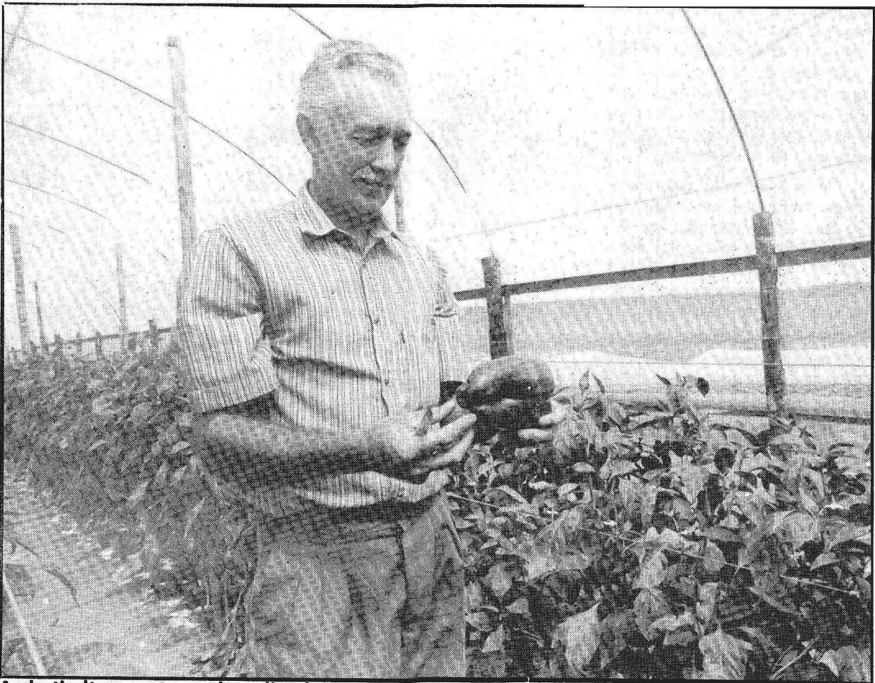
A plasticultura protege a hortaliça das pragas e aumenta a produtividade e vida da planta