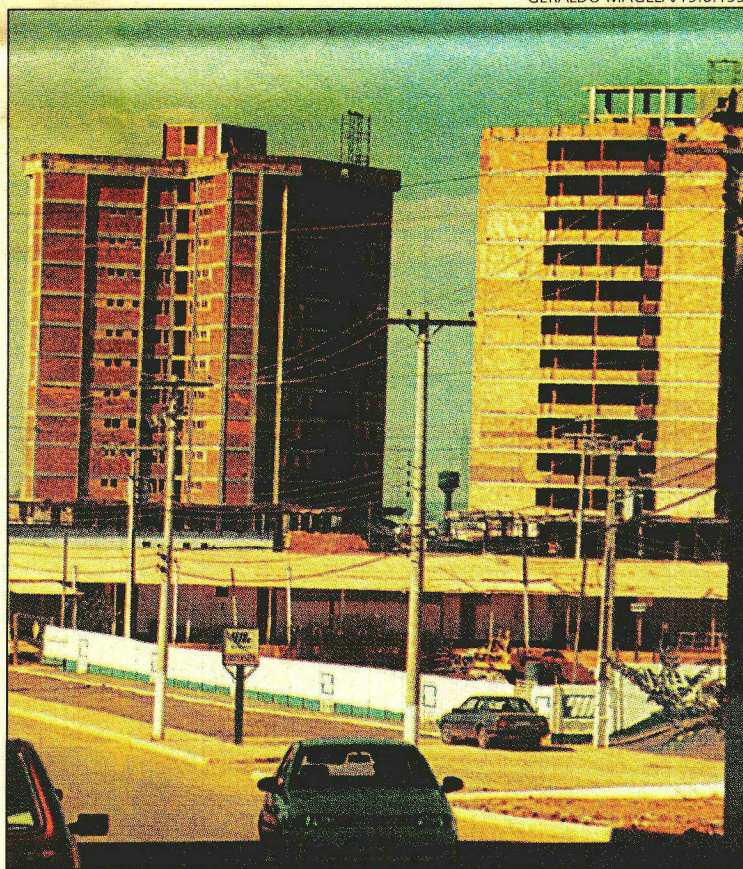
RITMO acelerado do crescimento exige resposta na educação

A perspectiva de crescimento abre oportunidades. "Os estabelecimentos de ensino são prestadores de serviços e estão descobrindo novos mercados", ressalta o subadministrador de Águas Claras.