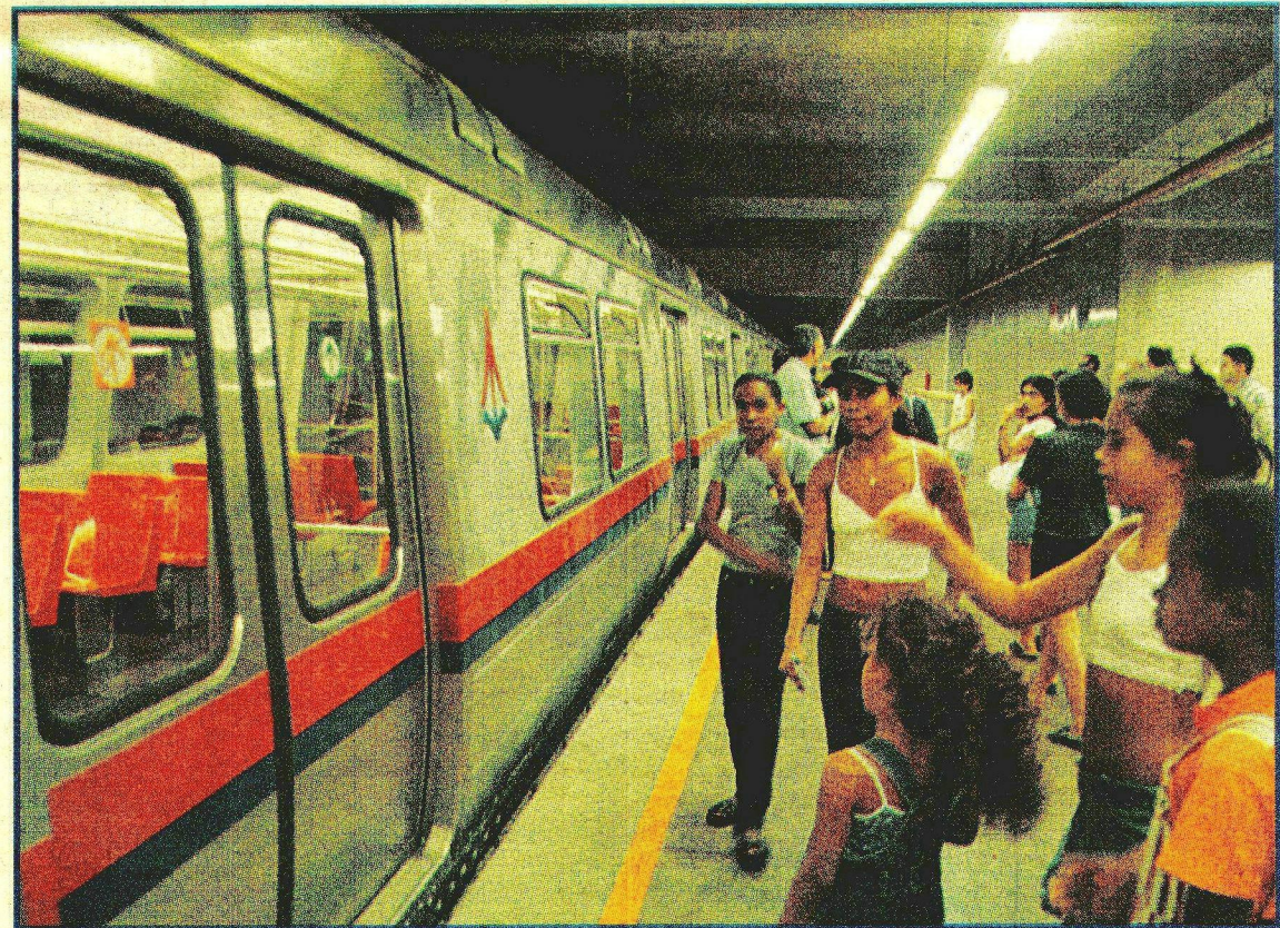
FACILIDADE de locomoção é um dos atrativos da cidade que nasceu para atender a classe média