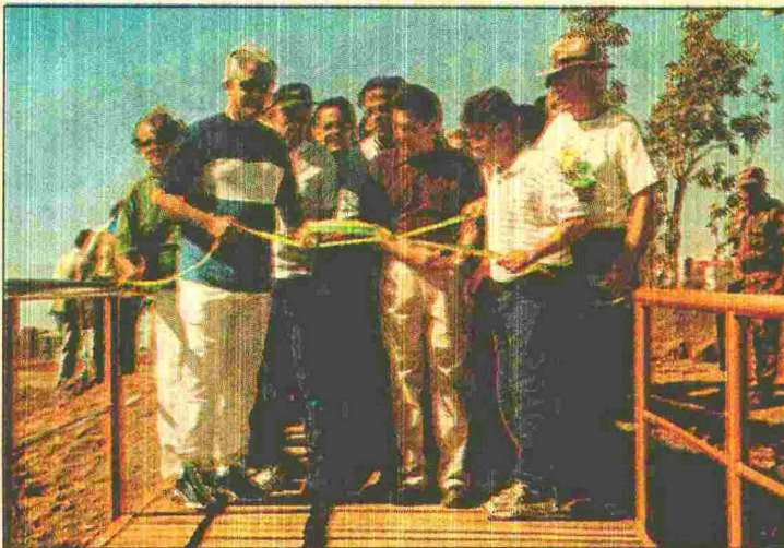
ESTE É o quarto parque inaugurado pelo governador Roriz