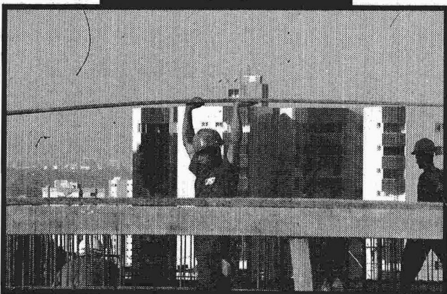
Metrô foi planejado para atender aos moradores e contribuir para o desenvolvimento de Águas Claras