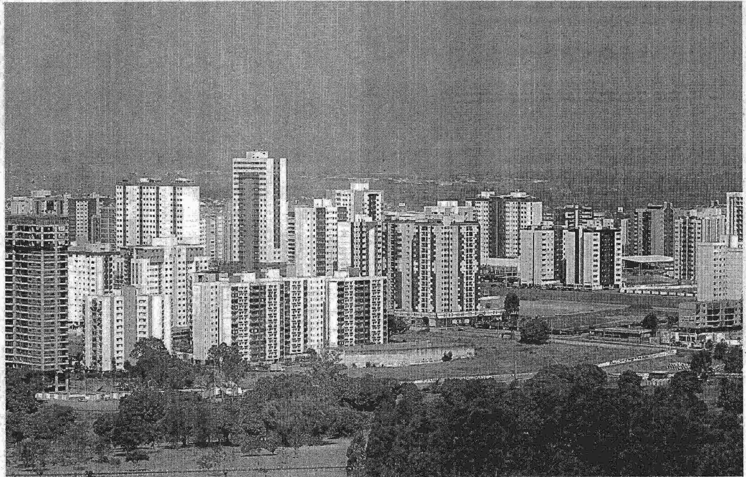
PRÉDIOS MAIS ALTOS E DE ARQUITETURA MODERNA TÊM ATRAÍDO MORADORES QUE QUEREM REALIZAR O SONHO DA CASA PRÓPRIA

"Temos uma ótima localização, entre o Plano Piloto, Guará e Taguatinga. Os imóveis têm qualidade e preços acessíveis"