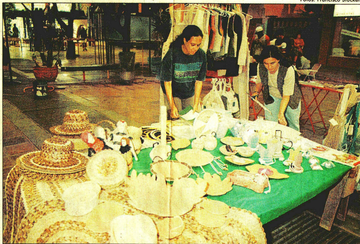
ARTESÃOS do DF mostram seus trabalhos hoje e em todo primeiro final de semana de cada mês