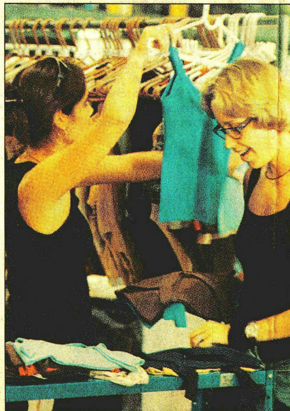
BSB Mix: roupas e acessórios alternativos