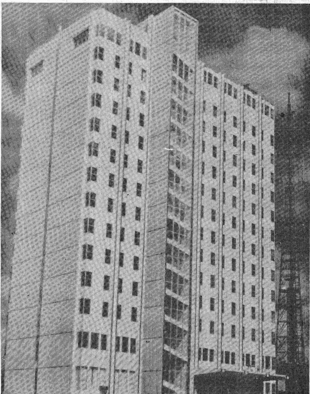
O Torre Palace Hotel é um dos que foram enquadrados pela Embratur, na categoria "A"