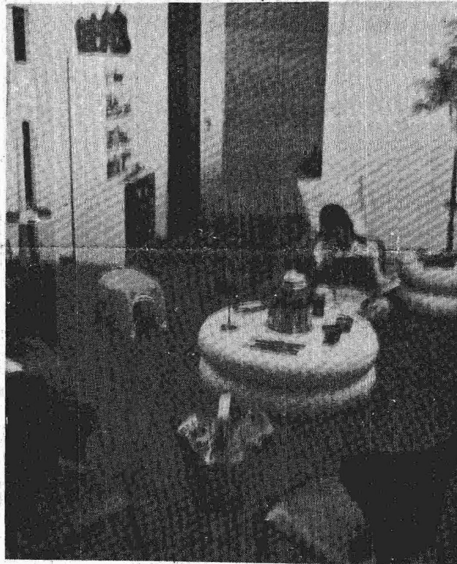
Seja qual for o tipo do apartamento, tudo foi escolhido e decorado para gente muito especial