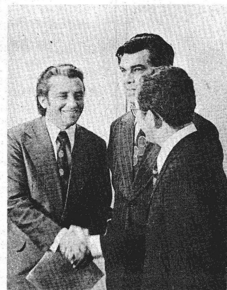
Os cumprimentos após a assinatura do convênio

Com o controle das propriedades rurais, a Secretaria de Agricultura e Produção melhorará o atendimento aos legítimos produtores do Cinturão Verde, eliminando de seu meio os que, não sendo rurícolas, conseguiram áreas apenas para uso indevido, transformando-as em chácaras para o lazer dos fins-de-semana.