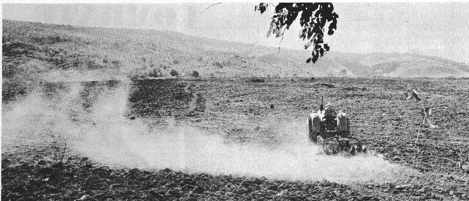
A assistência motomecanizada é o esteio da agricultura brasileira