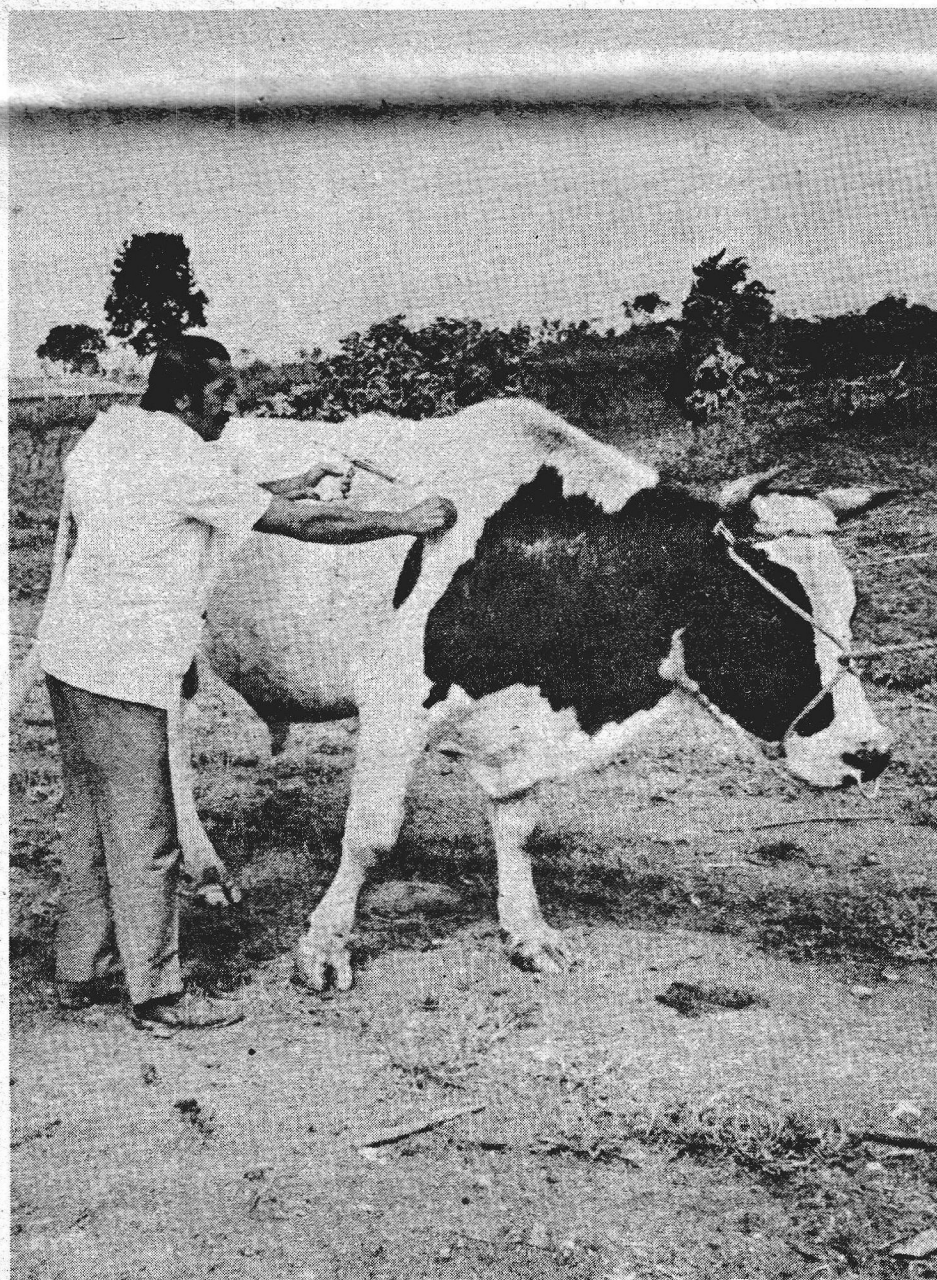
Além de atender nos quatro postos instalados, os técnicos da SAP se dirigiram às pequenas propriedades para assistir os pecuaristas menos informados