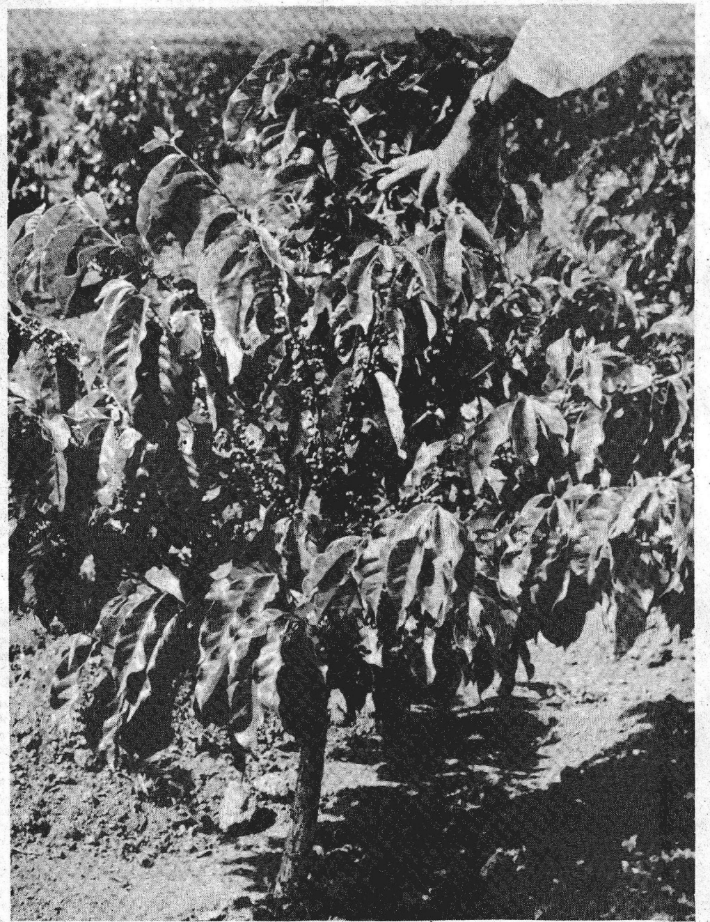
A produção agropecuária é essencial à região de Brasília, e seu estímulo é previsto em todos os programas do Centro-Oeste

Em alguns pontos, o trabalho a ser desenvolvido pelo Polocentro interessa ao Programa Geoeconômico de Brasília. E vice-versa. Por exemplo: a produção