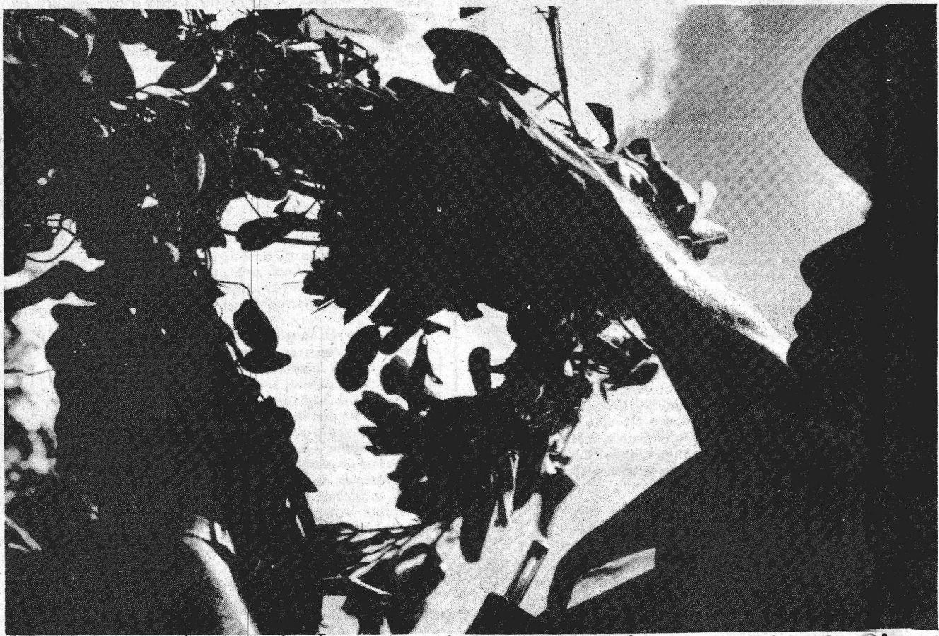
Municípios mineiros insistem em integrar a região econômica do Distrito Federal

Três programas estão sendo executados pelo Governo Federal, com o objetivo de acelerar o desenvolvimento econômico do Centro-Oeste brasileiro: a recuperação da zona do Pantanal mato-grossense, o Polocentro e o Geoeconômico de Brasília. São três instrumentos de maior importância que, em poucos anos, deverão estar produzindo frutos, principalmente em termos do estabelecimento do equilíbrio entre regiões.