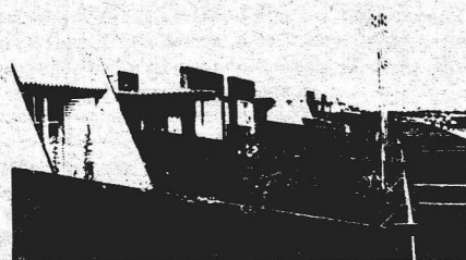
Novas e modernas residências para o mais novo Núcleo Habitacional do DF