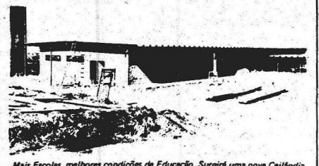
Mais Escolas, melhores condições de Educação. Surgirá uma nova Ceilândia em breve