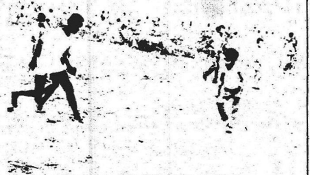
O lazer improvisado. Serão criados os minicentros.

Escolhido o projeto, o financiamento do material necessário lhe será fornecido em cinco etapas: alvenaria, paredes, cobertura, portas e janelas e equipamento e acabamento.