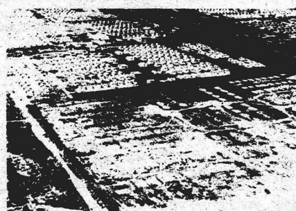
A Ceilândia terá, dentro em breve, um novo aspecto

Saiba como serão aplicados os 746 milhões de cruzeiros