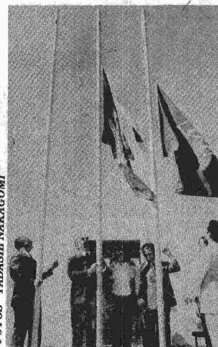
Hasteamento do pavilhão nacional