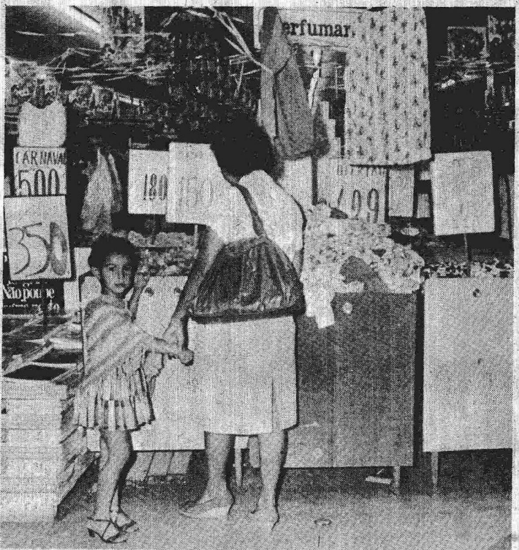
Compras: preferência pelos grandes magazines