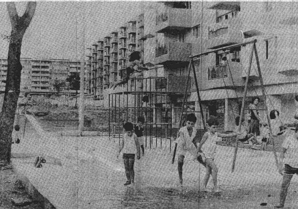
Parques, jardins e conservação da quadra, outra missão