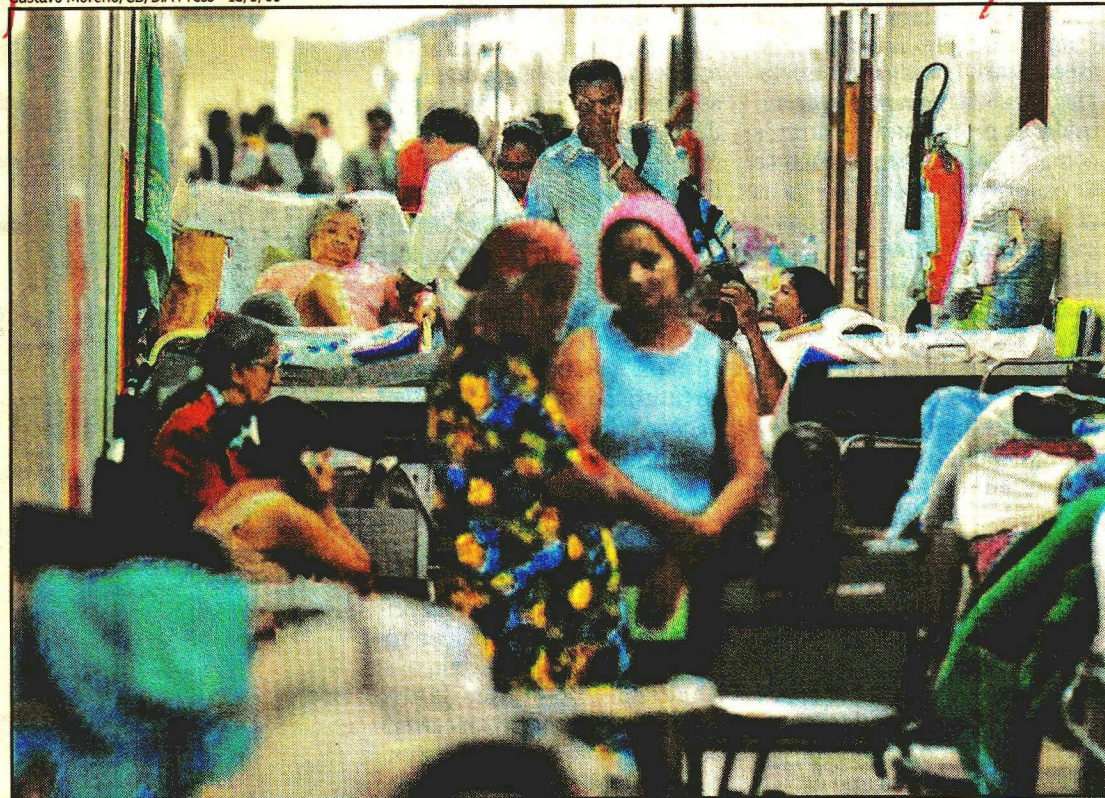
Profissionais de diversas áreas reforçarão emergências dos hospitais públicos, além do atendimento nos postos