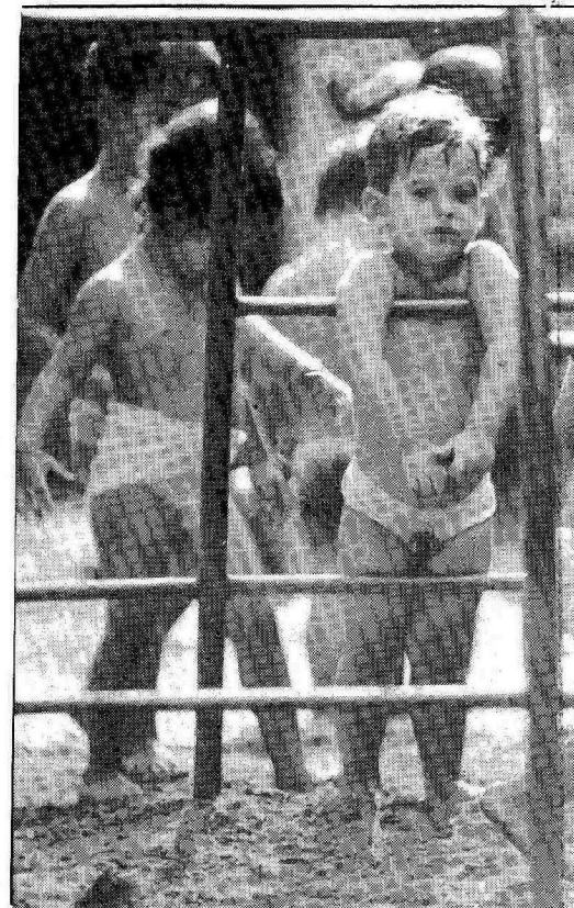
A temperatura alta provocou alterações no dia-a-dia das escolas: as crianças ficaram à vontade, para a recreação e na sala de aula