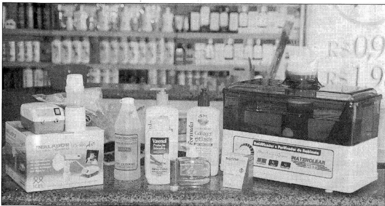
Produtos como soro fisiológico, hidratante e protetor labial são essenciais para enfrentar a seca