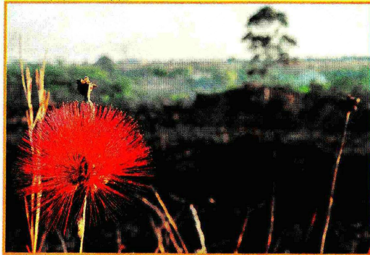
Área da Flona soma 9,3 mil hectares: reserva importante para o bioma

queimadas são a principal causa de desmatamento do cerrado no Distrito Federal. Mas, de acordo com a ministra, todo bioma no país é alvo não só de