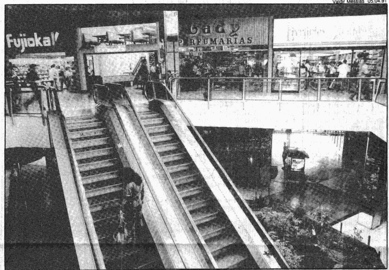
As lojas do ParkShopping querem que os aluguéis sejam congelados por 6 meses a partir de abril