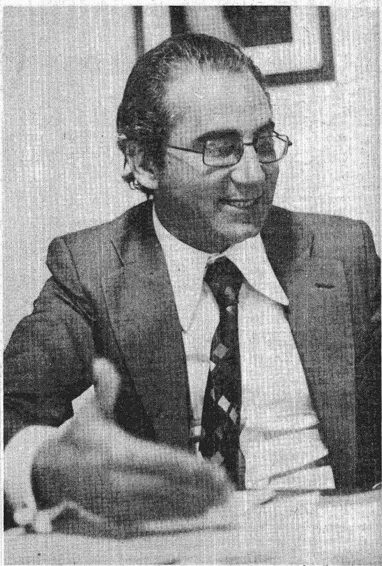
Frejat: resultado dos exames sai daqui a três dias