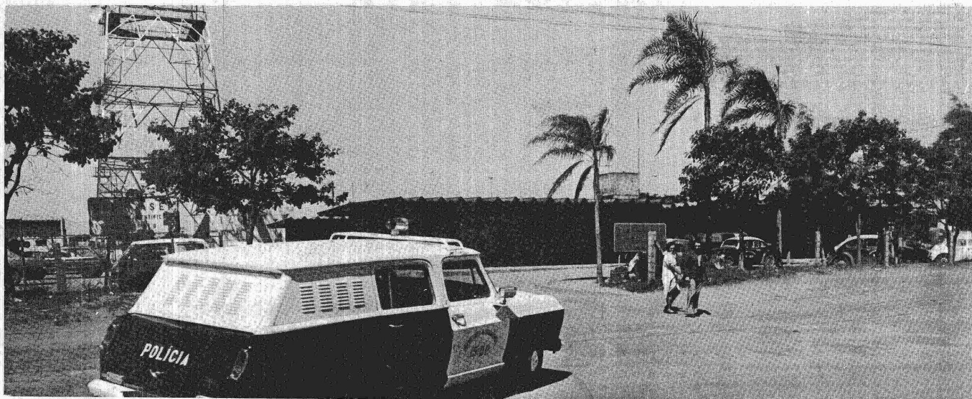
A Delegacia de Polícia Civil se desdobra para manter a segurança da população

Com o aumento populacional de Ceilândia é tão significativo, espera-se que, em breve, além de criada a Delegacia do Juizado de Menores o contingente dos dois órgãos existentes seja aumentado.