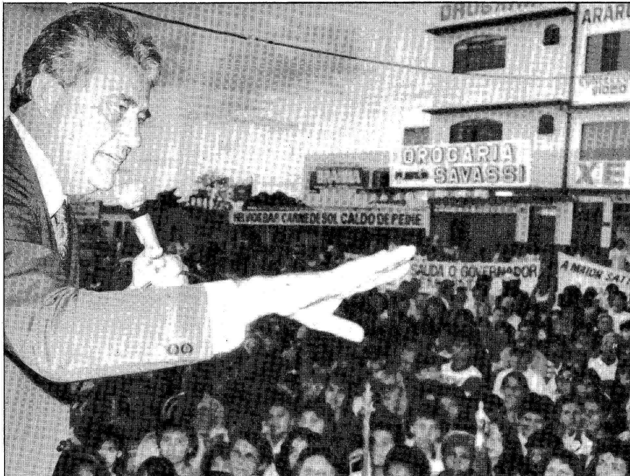
Roriz garantiu asfalto e rede d'água pluviais para toda Ceilândia até o final de seu governo

Em frente à Igreja São José, na QNM 22/24, Roriz finalizou a série de visitas e de assinatura de ordens de serviço, autorizando a construção de galerias pluviais nos conjuntos C, D, E, F e G da QNM 26 e pavimentação asfáltica dos conjuntos S, G e H da QNM 22 e conjuntos C, D, E, F, G, H, I, J, K, L, M e N da QNM 24. "São com pequenas obras que colocamos infraestrutura em toda uma cidade", disse o secretário José Roberto Arruda, acrescentando que o Programa Vida Melhor será levado a todas as satélites.