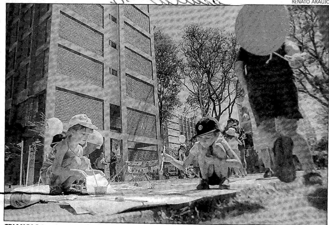
CRIANÇAS tomaram conta dos espaços no Panelão das Artes durante toda a manhã