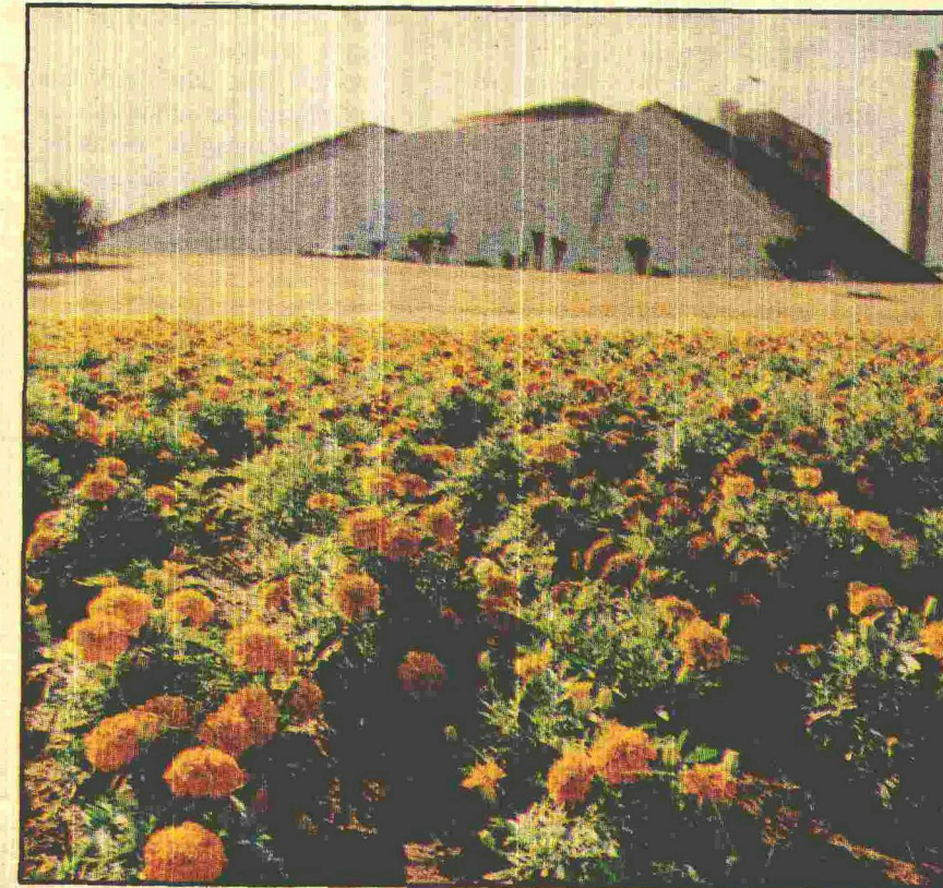
A beleza do canteiro ao lado do Teatro Nacional chama atenção

O presidente da Novacap, Newton de Castro, destacou que pretende implementar o programa de incentivo aos deficientes físicos e menores de rua na sua gestão. Ele destacou que a geração de empregos nesse setor pode ser intensificada. "Queremos ter 200 menores trabalhando conosco até o final do ano. Quanto aos deficientes físicos, todos serão bem-vindos", afirmou. O salário médio de um operário do DPJ é Cr$ 9,9 milhões. Os deficientes e menores ganham um salário de Cr$ 3,3 milhões.