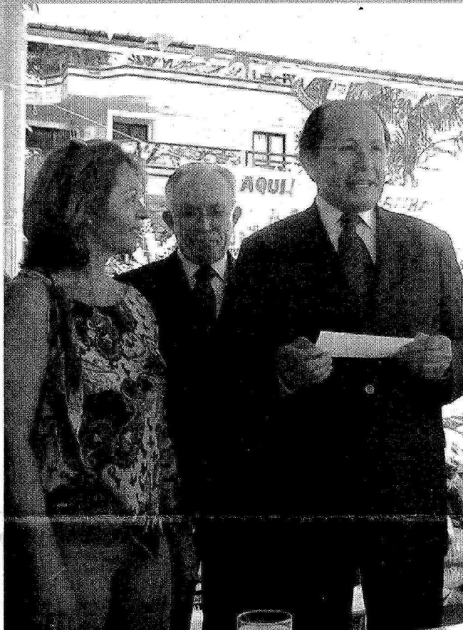
▲ A Diretoria da Gasol, ao lado da Presidência da Fecomércio/DF, na entrega do cheque simbólico dos donativos da campanha à representante de entidades carentes cadastradas no SESC

O dia mundial da doação de sangue, 14 de Junho, atraiu ao posto da 202 sul, dezenas de funcionários e clientes Gasol, em um mutirão de solidariedade para compor os estoques do Hemocentro de Brasília. A festa contou com um ônibus especial da instituição, equipado com aparelhos para coleta de sangue e uma equipe de médicos e auxiliares para acompanhamento e exames preliminares nos voluntários, além de um café da manhã revitalizador para os doadores.