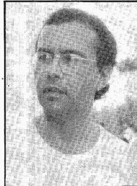
Orlando Carriello despontou como líder estudantil de esquerda. Hoje, é o presidente do PT em Brasília