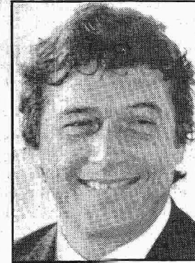
Teotônio Vilela Filho veio para o DF com o pai senador e estudou no Ciem. Hoje, é também senador, pelo PSDB -AL