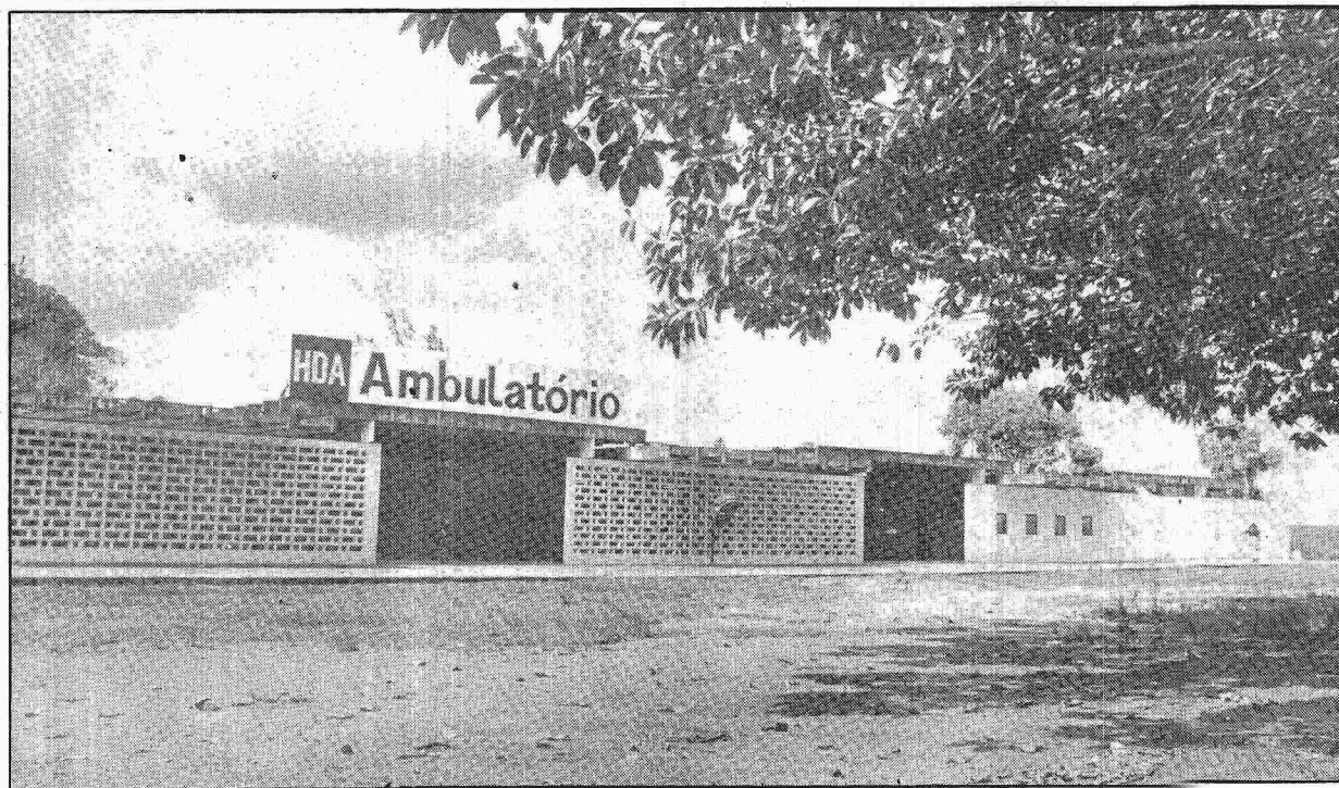
Da inédita experiência do Ciem, pouco restou. O antigo prédio foi doado e agora funciona o ambulatório do HDA