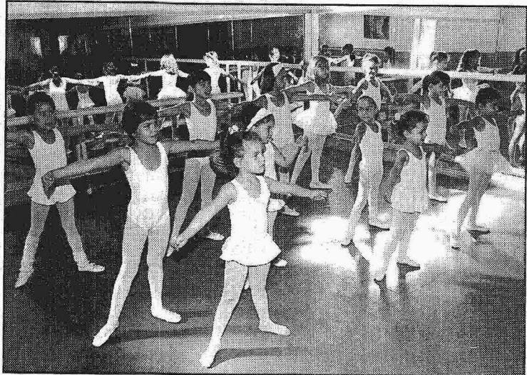
As atividades complementares abrangem desde o apoio ao ensino até aulas de dança e os esportes