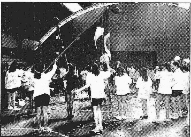
Festividades e manifestações cívicas obedecem a um programa que ajuda na evolução do aluno