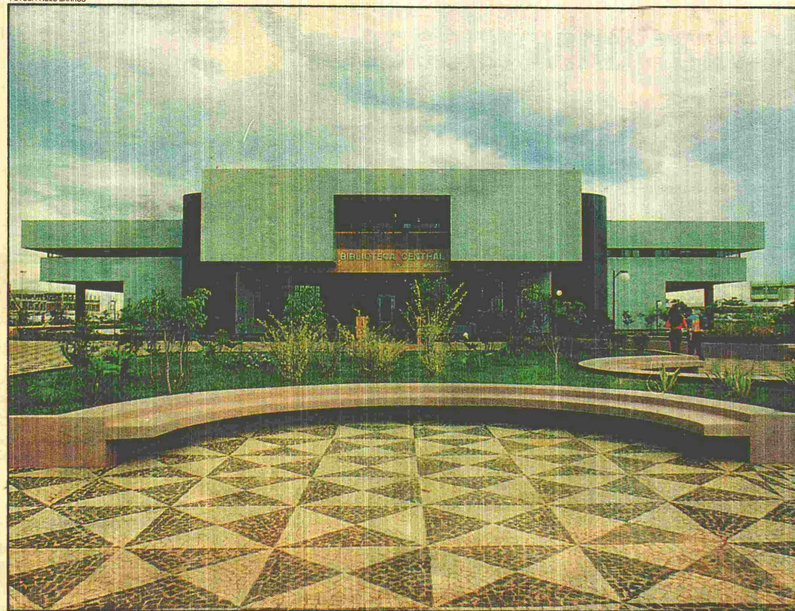
Novas e modernas instalações estão mudando a paisagem do campus da Católica de Brasília, que se transforma em um dos maiores do País