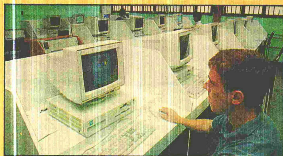
A Católica espera fornecer, em médio prazo, mestrado na área de informática

O curso de mestrado em Educação abre mais um ciclo para os cursos de especialização das Faculdades Integradas Católicas de Brasília (FICB). Há dez anos, a instituição oferece cursos de pós-graduação Latu Sensu , mas esta será a primeira vez que a Católica abre uma turma de mestrado. Para a implantação do projeto, a Católica formou