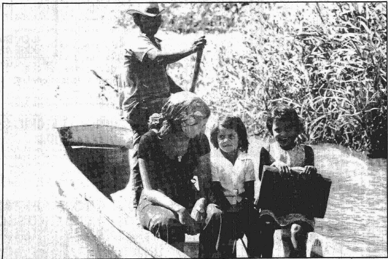
A canoa é o meio de transporte a que alguns professores e alunos têm de recorrer para chegar à escola