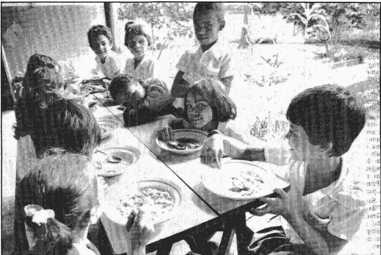
A merenda escolar é um dos problemas que mais preocupam os estudiosos da municipalização do ensino.

é atingirmos o total de 53 milhões, com a distribuição de mais 10 milhões de exemplares. O Ministério da Educação pretende também aumentar o período de distribuição da merenda escolar, de 180 para 270 dias, o que significa alimentar paralelamente, por meio do programa Irmãos, além dos alunos, sete milhões de crianças carentes que ainda não estão na escola. A construção de novas salas de aula, que gerará a abertura de um milhão de vagas, através da municipalização do ensino, é outra prioridade do Ministério, que utilizará, além dos recursos da União, investimentos dos convênios feitos com entidades interessadas em participar do projeto. O orçamento do MEC previsto para o próximo ano será de Cz$ 11 bilhões (30 por cento a mais que a verba deste ano), destinados à construção de escolas (Cz$ 4 bilhões), continuação do programa Escola e Educação para Todos (Cz$ 5 bilhões) e o Salário-Educação (Cz$ 2 bilhões), dos quais 25 por cento irão para os municípios.