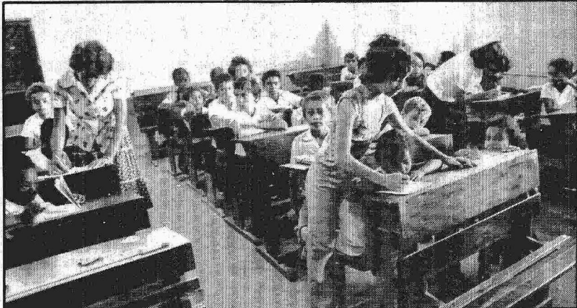
A falta de professores, alunos às vezes têm de dar aulas aos colegas

Cinco mil pessoas já participam do programa que está melhorando a educação em Taquara