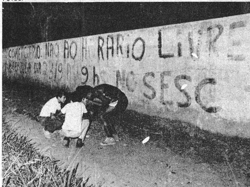
No escurinho é sempre possível preparar um saco com cola...