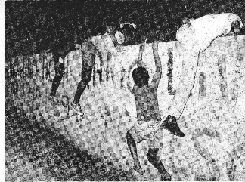
e depois pulá-lo para enfrentar o professor ou tentar um broto